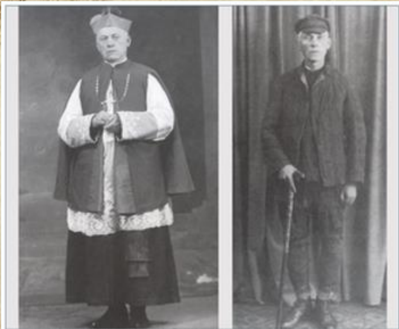
Vyskupas Teofilis Matulionis (1873–1962). Šalia – T. Matulionis tremtyje Mordovijoje (išbėgimas 1954 m.).

„Per crucem – ad astram“ – „Per Kryžių į žvaigždes“.